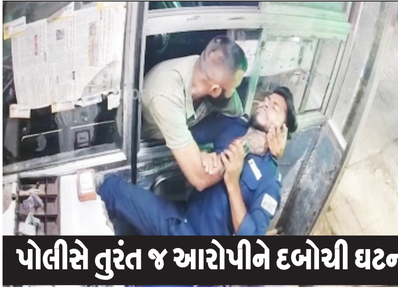
પોલીસે તુરંત જ આરોપીને દબોચી ઘટનાસ્થળે લઈ જઈ રિકન્સ્ટ્રક્શન કરાવ્યું