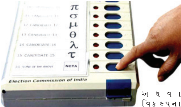
કારણોમાં સ્થાનિક સમસ્યાઓ, અભાવને કારણે મતદારોનું વિરોધી ઉમેદવારોની પસંદગીમાં અસંતોષ, વલણ હોઈ શકે છે.

એમના અગ્રણી તમજાવેલા આભાર વ્યક્ત કર્યો છે. આ આંકડો રાજકીય વિશ્લેષકો માટે અભ્યાસનો વિષય બન્યો છે. મતદારોએ ઉમેદવારો પ્રત્યેની પોતાની નારાજગી વ્યક્ત કરવા માટે 'નોટા'નું શસ્ત્ર ઉઠાવ્યું છે. તેમ જ ગણતંત્રીય રીતે જોતા, જો ૯,૧૧૯ મતદારોએ મતદાન કર્યું હોય અને ૩૬,૪૭૯ મતદારોએ મતદાન કર્યું હોય તો તેનો અર્થ એ થાય કે સરેરાશ દરેક મતદારે ૪ મત આપ્યા છે. રાજકોટ મહાનગરપાલિકાનું ૧૮ વોર્ડમાં કુલ ૫૧.૧૮ ટકા મતદાન નોંધાયું હતું, જેમાં ૫૫.૮૭ ટકા પુરુષ અને ૪૬.૧૫ ટકા મહિલાઓએ મતદાન કર્યું હતું.