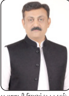
બનાવવાની દિશામાં સતત કાર્યરત રહીશું. અંતમાં, રાજકોટની જાગૃત જનતાનો હું હૃદયપૂર્વક આભાર માનું છું, જેમણે કોંગ્રેસ પક્ષ પર વિશ્વાસ વ્યક્ત કર્યો અને અમને સમર્થન આપ્યું.

પક્ષના વિચારોને જનતા સુધી પહોંચાડ્યા છે, જે બદલ હું તમામનો હૃદયપૂર્વક આભાર વ્યક્ત કરું છું. તેમનો જુરસો અને પ્રતિબદ્ધતા કોંગ્રેસ પક્ષની સાચી તાક્ષર છે. કોંગ્રેસ પક્ષ હંમેશા જનાદેશ, પારદર્શિતા અને વિકાસના માર્ગે પ્રતિબદ્ધ રહ્યો છે અને આગળ પણ રાજકોટ શહેરના સર્વાંગી વિકાસ માટે સહકારાત્મક તથા રચનાત્મક ભૂમિકા ભજવતો રહેશે. પ્રજાના વિશ્વાસને વધુ મજબૂત બનાવવા અમે લોકોના અવાજને સશક્ત