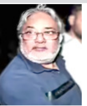
ગૃહમંત્રી અમિત શાહે આ ઓપરેશનને બિરદાવતા કહ્યું કે, “મોદી સરકાર ડ્રગ્સના કારોબાર

અબતક, નવી દિલ્હી ભારતીય તપાસ એજન્સીઓને એક મોટી સફળતા મળી છે. અંડરવર્લ્ડ ડોન દાઉદ ઈબ્રાહિમનો ખાસ સાગરિત અને આંતરરાષ્ટ્રીય ડ્રગ માફિયા મોહમ્મદ સલીમ ડોલાને મંગળવારે સવારે તુર્કીથી ભારત લાવવામાં આવ્યો છે. છેલ્લા બે વર્ષથી ભારતની સેન્ટ્રલ એજન્સીઓ અને નારકોટિક્સ કંટ્રોલ બ્યુરો તેની શોધમાં હતી. તેને ઈસ્તંબુલથી એક ખાસ વિમાન દ્વારા દિલ્હી લાવવામાં આવ્યો છે.