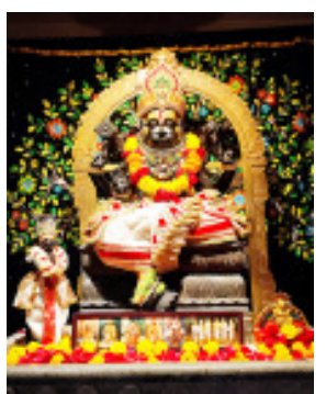
આ નરસિંહ ચતુર્દશીનો ૩૦ એપ્રિલ ગુરુવારે રાજકોટના ઈસ્કોન મંદિર ખાતે સવારે ૧૦:૦૦ વાગ્યે: