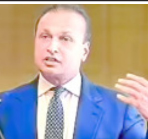
ઈડીનો આરોપ છે કે આ જાહેર નાણાંની હેરફેરી કરવામાં આવી હતી. બંકો આને જનતાના હિતોનું રક્ષણ કરવા માટે આ મિલકતો ટાંચમાં લેવામાં આવી છે જેથી તે વેચી શકાતી નથી.

અબતક, નવી દિલ્હી મની લોન્ડરિંગ કેસમાં મુશ્કેલીનો સામનો કરી રહેલા અનિલ અંબાણી અને તેમની શિવાયન્સ ગ્રુપની કંપનીઓ પર એન્ફોર્સમેન્ટ ડિરેક્ટોરેટએ વધુ એક કડક પગલું ભર્યું છે. ઈડીએ મંગળવારે અનિલ અંબાણીના પરિવારની આશરે રૂ. ૩,૦૩૫ કરોડની મિલકતો ટાંચમાં લીધી છે. આ સાથે જ આ કેસમાં અત્યાર સુધીમાં કુલ રૂ. ૨૦,૦૦૦ કરોડની મિલકતો જમ કરવામાં આવી છે. મુંબઈમાં ઉષા કિરણ બિલ્ડિંગમાં આવેલો આલીશાન ફ્લેટ, ખંડાલામાં એક મોટું