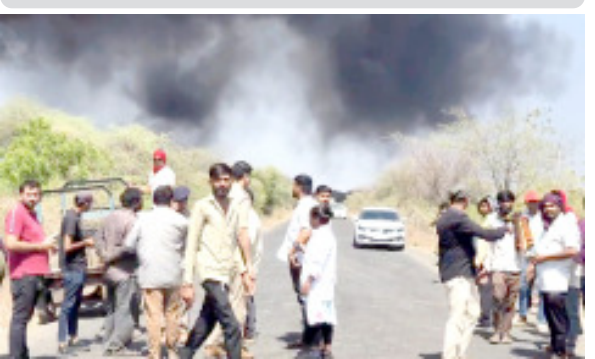
આગે વિકરાળ સ્વરૂપ ધારણ કરતા સુરેન્દ્રનગર અને લીંબડીની કાયદર કાયદર ટીમોએ સ્થળ પર પહોંચી આગ પર કાબૂ મેળવવા અને