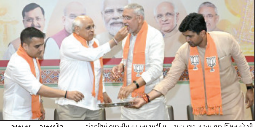
અભતક, રાજકોટ ચૂંટણીમાં ભારતીય જનતા પાર્ટીના મહાનગરના ખાનપુર સ્થિત જે.પી. સ્થાનિક સ્વરાજ્યની ભવ્ય વિજયને વધાવવા કણવિતી ચોક ખાતે મુખ્યમંત્રી ભૂપેન્દ્રભાઈ

પટેલ, ભાજપા પ્રદેશ અધ્યક્ષ જગદીશભાઈ વિશ્વકર્મા, નાયબ મુખ્યમંત્રી હર્ષભાઈ સંઘવીની વિશેષ ઉપસ્થિતિમાં ભાજપા દ્વારા વિજયોત્સવ મનાવાયો હતો. મુખ્યમંત્રી ભૂપેન્દ્રભાઈ પટેલે તેમના સંબોધનમાં સ્થાનિક સ્વરાજ્યની સંસ્થાઓની ચૂંટણીમાં ભારતીય જનતા પાર્ટીને મળેલા ભવ્ય વિજય બદલ સમગ્ર ગુજરાતની જનતા જનાર્દનને સહૃદય કોટી કોટી વંદન કરતાં જણાવ્યું કે આજનો વિજય જનતાના ભાજપા પ્રત્યેના (અનુ. આઠમા પાને)