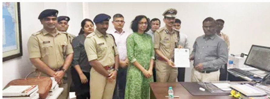
જવાબદાર પદ પર બેઠેલા લોકપ્રતિનિધિ દ્વારા પોલીસ તંત્ર માટે દલાલ, લફંગા અને દફા જેવા અપશબ્દોનો પ્રયોગ કરવો એ લોકશાહીની ગરિમા વિરુદ્ધ છે. તાજેતરમાં વિસાવદરના ધારાસભ્ય ગોપાલ ઈટાલિયાએ ફેસબુક વાઈવ દરમિયાન પોલીસ તંત્ર અને ચૂંટણી પ્રક્રિયા પર ગંભીર આક્ષેપ કર્યા હતા. તેમણે આક્ષેપ કર્યો હતો કે, સમગ્ર

અબતાક રાજકોટ ગુજરાત રાજ્યમાં સ્થાનિક સ્વરાજની ચૂંટણીના ગરમાવા વચ્ચે રાજકીય નિવેદન બાજુ હવે કાયદાકીય અને વલીવટી મોરચે મોટું સ્વરૂપ ધારણ કર્યું છે. આમ આદમી પાર્ટીના અગ્રણી અને ભેદસાણના ધારાસભ્ય ગોપાલ ઈટાલિયાએ સોશિયલ મીડિયાના માધ્યમથી પોલીસ અધિકારીઓ માટે અત્યંત અપમાનજનક શબ્દોના વિરોધમાં ગુજરાત આઈપીએસ એસોસિએશન મેદાને આવ્યું છે. રાજ્ય ચૂંટણી આયોગ અને ગૃહ વિભાગને લેખિત આવેદન આપી ધારાસભ્ય ગોપાલ