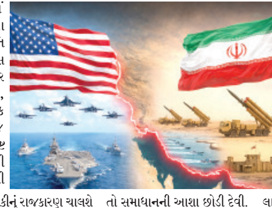
બેઠકમાં અમેરિકાના ઉપરાષ્ટ્રપતિ જે.ડી. વેન્સેલેના છે. પરંતુ બેઠક પહેલા જ ઈરાને સ્પષ્ટ થયે ત વણી આપી દીધી છે કે જો ધમકીનું રાજકારણ ચાલશે તો સમાધાનની આશા છોડી દેવી. બાવચોળ છે. ઈરાનનું કહેવું છે કે

અબતક, રાજકોટ પશ્ચિમ એશિયામાં છેલ્લા કેટલાક સમયથી ચાલી રહેલી ખંચતાણ હવે નિર્ણાયક વળાંક પર આવી પહોંચી છે. ઈરાન અને અમેરિકા વચ્ચેના સંબંધોમાં 'ઈલુ ઈલુ' જેવી ક્ષણિક નરમાશને બદલે જો કાયમી શાંતિનું 'ઘર માંડવું' હોય, તો ઈરાને હવે કડક વલણ સાથે પોતાની તૈયારી દર્શાવી છે. પાકિસ્તાનની મધ્યસ્થી હેઠળ યોજાતારી આ હાઈ-પ્રોફાઈલ