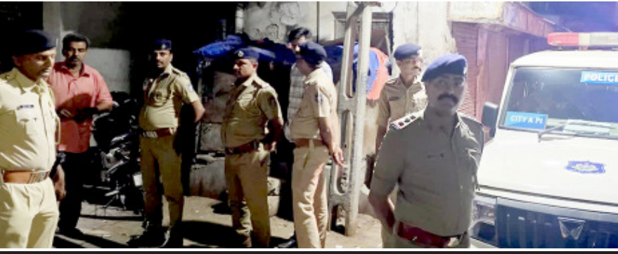
ચા-પાનના ગણા પર જમાવડો કરતા આવારા તત્વો સામે લાલ આંખ, પોલીસને જોઈ અસામાજિક તત્વોમાં નાસભાગ