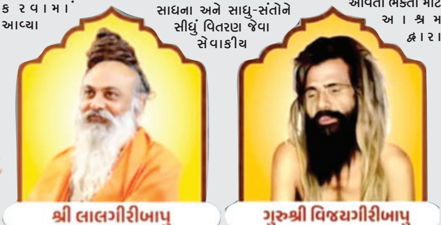
શ્રી લાલગીરીબાપુ સાધના અને સાધુ-સંતોને સીધું વિતરણ જેવા સેવાકીય શ્રી લાલગીરીબાપુ ક રવા માં આગળ પાલિતાણાને દુલ્હનની જેમ શણગારવામાં આવ્યું છે. મુખ્ય માર્ગો, ઓવરબ્રિજ અને શહેરના પ્રમુખ સર્કલો રોશની તથા ઘજા-પતાકાથી ઝળહળી ઉઠ્યા છે. યાત્રાના માર્ગ પર વિવિધ સામાજિક સંસ્થાઓ દ્વારા શ્રદ્ધાળુઓ માટે ઠંડા પાણી અને શેરડીના રસના સ્ટોલ ઊભા

દ્વારકા શારદાપીઠાધીશ્વર જગદગુરુ શંકરાચાર્ય સ્વામી સદાનંદ સરસ્વતીજી મહારાજના પરમ પ્રિય શિષ્ય બ્રહ્મચારી નારાયણનંદજી તેમજ જૂનાગઢના સાધુ-સંતોની ગરિમામય ઉપસ્થિતિમાં પોથીજીનું શાસ્ત્રોક્ત વિધિથી પૂજન કરવામાં આવ્યું હતું. આ પોથીયાત્રામાં