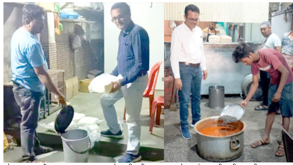
અંદાજત ૩૩ કિ.ગ્રા. અખાધ જથ્થો સ્થળ પર નાશ કરવામાં આવ્યો હતો. પેટીને લાઈજનિક કન્ટેનર નાશ જાળવવા, યોગ્ય સ્ટોરેજ જાળવવા બાબતે નોટીસ આપવામાં આવી હતી.

મોરબી રોડ હોર્સ ઓનમાં ખાદ્યચીજોનું વેચાણ કરતા ૧૯ ધંધાર્થીઓ ત્યાં ચેકીંગ અબતક, રાજકોટ ૨૧ જુલાઈ ૨૦૨૪ મહાનગરપાલિકાની આરોગ્ય શાખા સર્વેલન્સ ચેકિંગ ટરમિયાન બનકી એવન્યુ, શિવ દ્રષ્ટિ પાર્ક, મવડી ૮૦ ફટ રોડ પર "નીલકંઠ ઢોસા" પેટીની તપાસ કરતા સ્થળ પર સંગ્રહ કરાયેલા વાસી સંભાર તથા મંચુરિયનો