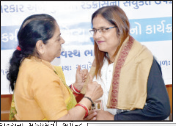
રાજ્યના મુખ્યમંત્રી ભૂપેન્દ્ર પટેલના દિશાનિર્દેશનમાં ફીટ

અબતક, ભારતી માખીબાણી, ગાંધીધામ ગુજરાત સરકાર અને ગુજરાત રેડક્રોસના સંયુક્ત ઉપક્રમે આજરોજ ગાંધીધામના રેડક્રોસ ભવન ખાતે પત્રકારો માટે હેલ્થ ચેકઅપ કેમ્પનું આયોજન કરવામાં આવ્યું હતું.