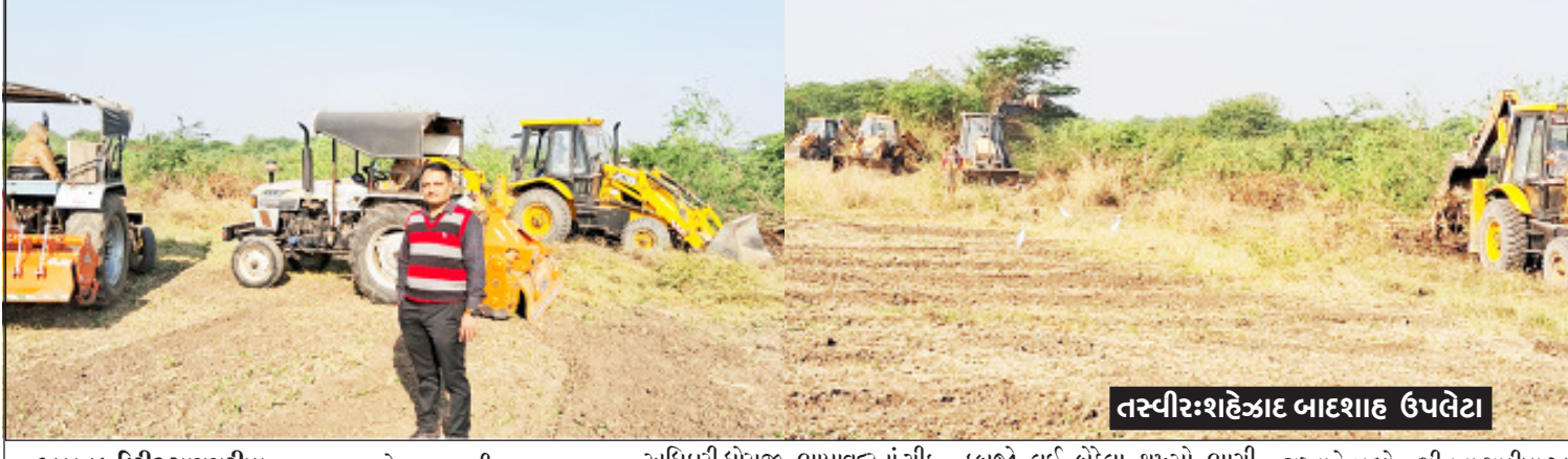
તસ્વીર:શહેઝાદ બાદશાહ ઉપલેટા

અખતક, કિરિટ રાણપરિયા, ઉપલેટા ઉપલેટા નગરપાલીકાની માલિકી ધરાવતી પાટણવાવ રોડ ઉપર આવેલ લાડકોડી ગામના સર્વે નં. ૧૮ વાળી ૧૨૦૦ વિદ્યા જમીનમાં માથાભારે શખ્સો કબજો જમાવી બેઠા હોય આખરે આ ગોચરની જમીન ઉપર ૧૫ જેટલા અધિકારી ધોરાજી-ભાયાવદરનાં ચીફ ઓફીસરો પાટણવાવ, ધોરાજી, ઉપલેટા, ભાયાવદર પોલીસ ૫૦ વાલનો કાફલા સાથે ૨૦૦ જેટલા અધિકારીઓ ક્રમ્પીઓ વહેલી સવારે ભાદરકાંઠા પાસે આવેલ એનીમલ હોસ્ટેલમાં પાછળ આવેલ જમીન ઉપર ૧૫ જેટલા બુલ ડોઝરો ૫ જેટલા રોટવેસ્ટો ફરી વળતા જમીનનો કબજો લઈ બેઠેલા શખ્સો ભાગી છુટ્યા હતા. ગઈકાલે શહેરના ઈતિહાસમાં પ્રથમ વખત ૯૦ કરોડની કિંમત ધરાવતી ૧૨૦૦ વિદ્યા જમીન ગોચર માટે ખાલી કરાવતા તંત્ર દ્વારા સતત બીજા દિવસે પણ ડિમોલિશન જાળવી રાખ્યું છે. નગરપાલિકા હસ્તકની ગોચરની જમીન ઉપર ગૌ માતાને ચરવાને બદલે જમીનના માફીયા આ જમીનનો ચરી જતા પ્રથમ દિવસે એનીમલ હોસ્ટેલથી લાડકોડીથી સમઢીયાળા રોડ સુધી સતત આખો દિવસ બુલડોઝર ચાલુ રહ્યા હતા બે દિવસ બાદ ભાદરકાંઠાના ચીખલીયાવાળા રસ્તા ઉપર પણ ગેરકાયદે દબાણ હટાવવામાં આવશે તેવું તંત્ર દ્વારા જાણવા મળ્યું છે.