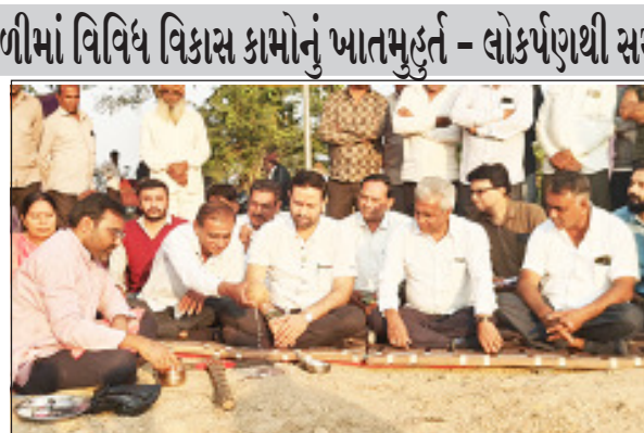
અને સિંચાઈને મુખ્ય લક્ષ્યમાં રાખીને આ વિકાસકાર્યોનું ખાતમુહૂર્ત અને લોકાર્પણ કરવામાં આવ્યું હતું. સાજીયાવદર ગામે રૂ. ૩૮ લાખના ખર્ચે પ્રાથમિક આરોગ્ય કેન્દ્ર તથા અનુસૂચિત જાતિ વિસ્તારમાં રૂ. ૦૩ લાખના ખર્ચે ઈ.ઈ.રોડના કામનું ખાતમુહૂર્ત કરવામાં આવ્યું હતું. રૂ. ૪૧ લાખના ખર્ચે વિકસિત થનારી આ સુવિધાઓથી સાજીયાવદરના ગ્રામજનોની સુખકારીમાં વધારો થશે આ પ્રસંગે કૌશિકભાઈ વેકરીયાએ જણાવ્યું હતું કે, તાજેતરમાં જ રાજ્યમાં મુખ્યમંત્રી ભૂપેન્દ્રભાઈ પટેલના નેતૃત્વમાં