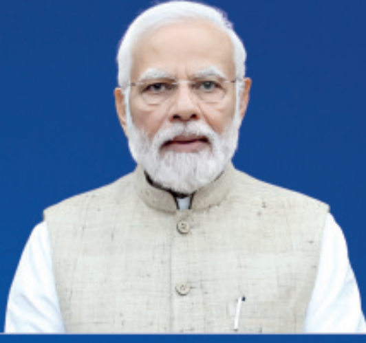
શ્રી નરેન્દ્ર મોદી માનનીય વડાપ્રધાન, ભારત