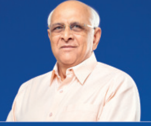
શ્રી ભૂપેન્દ્રભાઈ પટેલ માનનીય મુખ્યમંત્રી, ગુજરાત